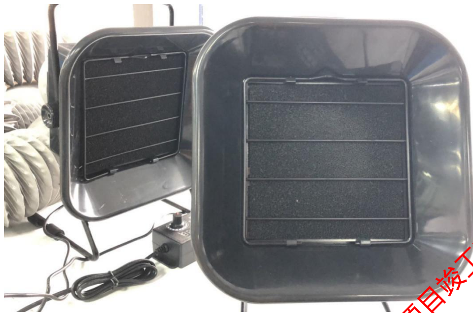
图 3-2 移动式烟气净化装置