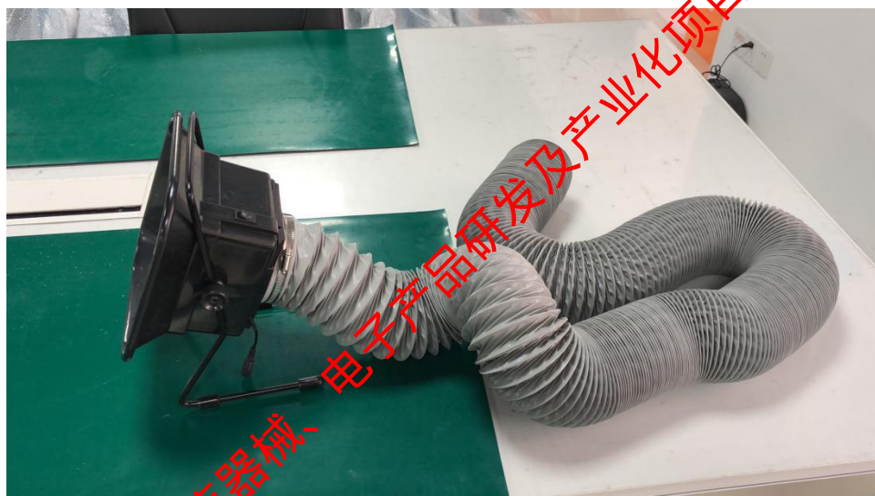
图 3-1 移动式烟气净化装置